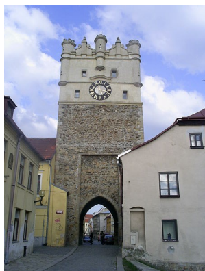
Jihlava, donde Mahler creció.