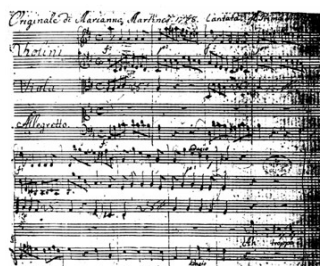
Partitura autógrafa original de la cantata Il Primo Amore